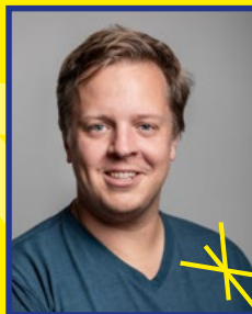
ALEXANDER VON KROSIGK